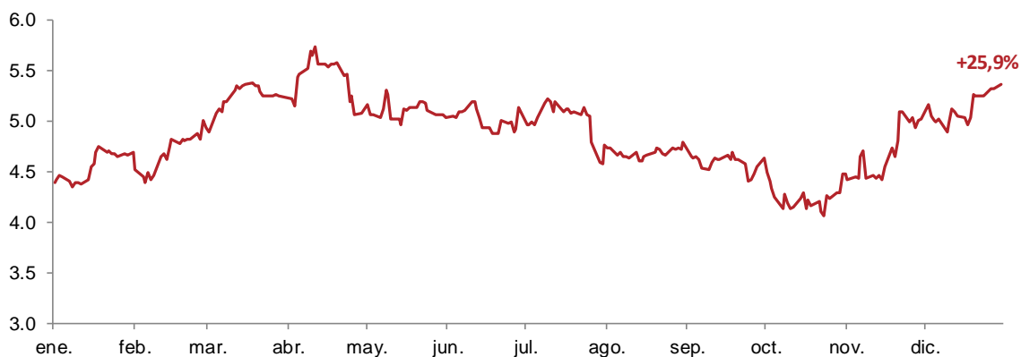
Evolución bursátil de Talgo vs. Ibex 35 y EuroStoxx 50 el periodo enero-diciembre 2018